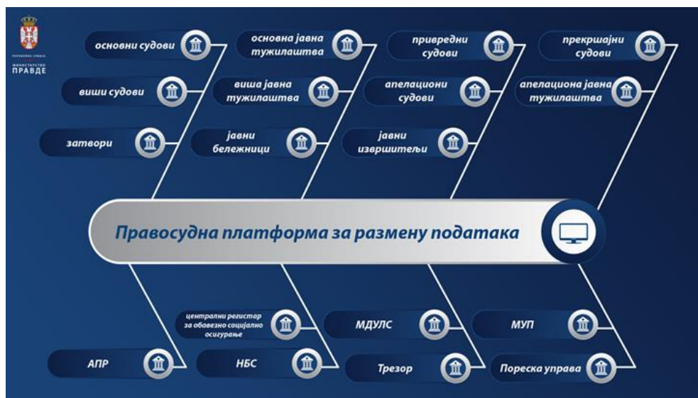
Слика 1. Скица система Enterprise Service Bus-а

Инфраструктурна платформа за интероперабилност представља систем који омогућава електронску размену података између различитих правосудних институција и државних органа ван система правосуђа. Правосудна платформа за размену података заснована је на Enterprise Service Bus који је вендорско решење компаније Мајкрософт ( Microsoft BizTalk Server ), док је Правосудни информациони систем портал за приступ корисника сету података за који су посебно овлашћени користећи наведени ЕСБ односно Правосудну платформу за размену података. (Слика 1.)